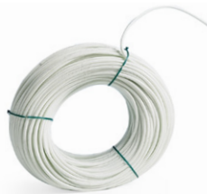
Gaine silisol standard \varnothing 5, 6 ou 8 mm