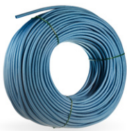
Gaine silisol bleu \varnothing 5 ou 6 mm