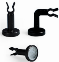
Support pour tube fibre de verre SPAGLESS